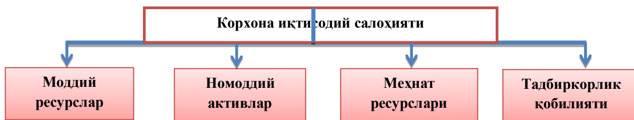
1-расм. Корхона иқтисодий салоҳияти 5

салоҳияти уларнинг моддий ресурслар, номоддий активлар, меҳнат ресурслари ҳамда тадбиркорлик қобилиятини яхлит бир тизимда мужассамлашган ҳолда ифодалайди.